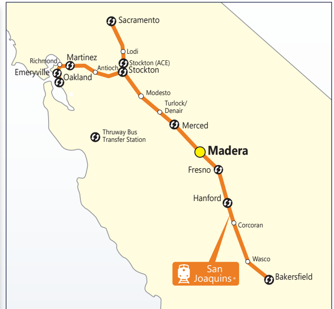
Figura 1. Mapa de Ruta Actual de San Joaquín

SJJPA es responsable de la gestión del servicio de ferrocarril de San Joaquín y es la agencia principal de CEQA para este esfuerzo. Para ayudar a garantizar un proceso exitoso, la SJJPA está trabajando cercano a la Comisión de Transporte del Condado de Madera, el Condado de Madera, la Ciudad de Madera, la Agencia de Transporte del Estado de California (CalSTA) y la Autoridad de Trenes de Alta Velocidad de California (CHSRA).